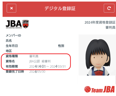
デジタル登録証 見本